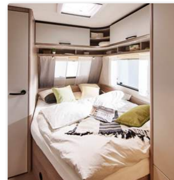
Abbildungen zeigen das Modell Premio SkyLine.

Sondermodell mit bis zu 4.930,- €* Preisvorteil