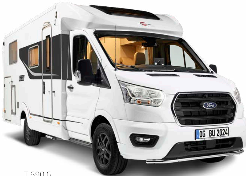
T 690 G

Nutzen Sie die vielen Vorteile der InterCaravaning – alles aus einer Hand auf www.intercaravaning.de